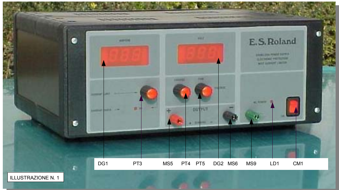
ILLUSTRAZIONE N. 1